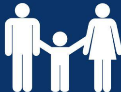
AKTÍV KERESŐK, CSALÁDOK