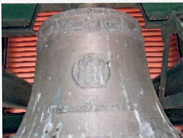
A 180 kg-os nagyharang