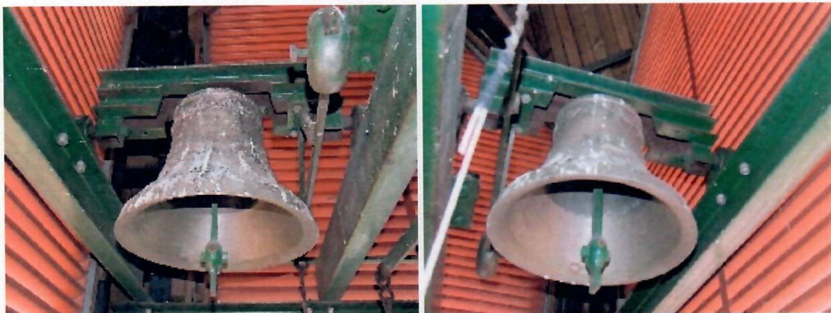
A 30 kg-os kisharang