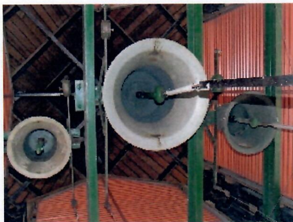
A három harang a toronyban

Az épület környékén a parkolás fizetős, a templom az autóbusz állomástól gyalog 5 perc alatt megközelíthető.