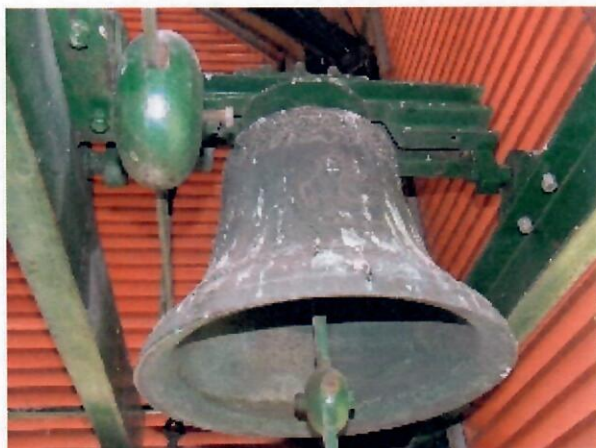
A 60 kg-os középharang